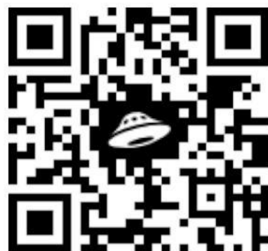
Фото- и видеоматериалы для квеста