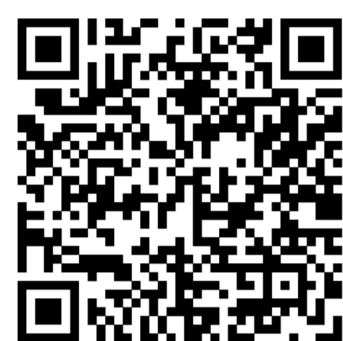
Порядок создания первичных отделений

Заполненный Протокол заседания инициативной группы, Оформленное заявление о создании Первичного отделения