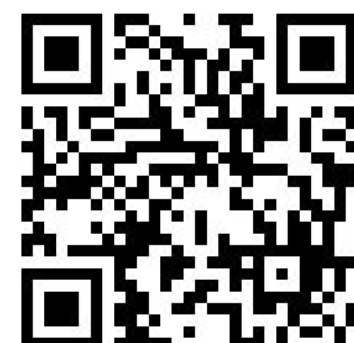
Положение о первичных отделениях